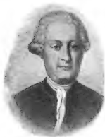
Joseph Leopold Auenbrugger.

das Gefässsystem und die Nervenphysiologie hervor. Haller hat den von Glisson (1597—1677) aufgestellten Begriff der Irritabilität genauer definiert. Er wies nach, dass jeder tierische Organismus zwei Formen von Bewegungen aufweist, erstens